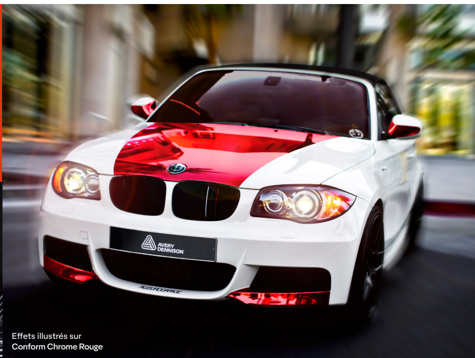
Effets illustrés sur Conform Chrome Rouge

L'utilisateur a la responsabilité de déterminer si le produit convient pour l'application prévue. Ce produit doit être utilisé après avoir été testé et approuvé. Certains états peuvent avoir défini des lois ou des réglementations quant à l'utilisation