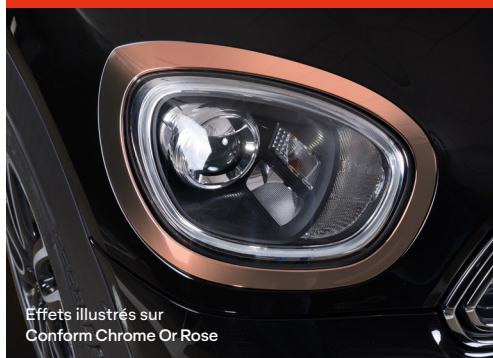
Effets illustrés sur Conform Chrome Or Rose

Faites briller votre design avec des accents Chrome effet miroir pour une finition haut de gamme.